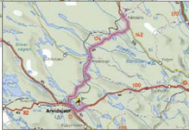
Anfahrtsskizze vom Flughafen Arvidsjaur mit Zwischenstopp in Kåbdalis nach Gällivare / Koskullskulle

Und Vorsicht bei der Fahrt: Hier laufen Rentiere und Elche auf der Straße herum! Von den Tieren häufig frequentierte Stellen sind mit schwarzen Flaggen am Straßenrand gekennzeichnet.