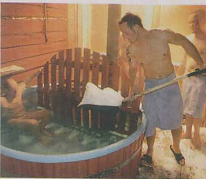
Fast ein Tagesablauf à la Bonzerosa: rasten, fahren und hernach ruhen