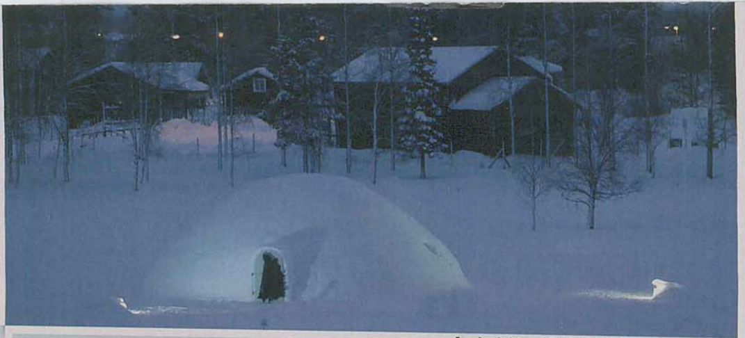
Auch nicht schlecht, so ein tiefgefrorenes Winterstandbild